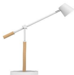
Lampe LED VICKY

Faites de votre espace de travail, un lieu de bien-être, en ajoutant plus de mouvement à votre journée et en combattant la sédentarité, un problème majeur de santé publique. Découvrez aussi notre gamme bois/blanc d'inspiration scandinave qui s'intégrera parfaitement avec le bureau électrique ERGO WELL