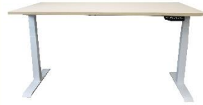
Bureau électrique ERGO WELL

Découvrez aussi notre gamme bois/blanc d'inspiration scandinave qui s'intégrera parfaitement avec le porte manteau TIPY.