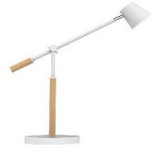
Lampe LED VICKY